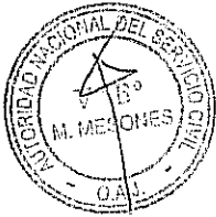
NURIA ESPARCH FERNANDEZ Presidenta Ejecutiva AUTORIDAD NACIONAL DEL SERVICIO CIVIL